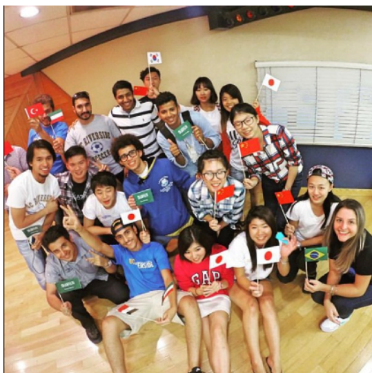
图为国际项目中来自世界各国的留学生