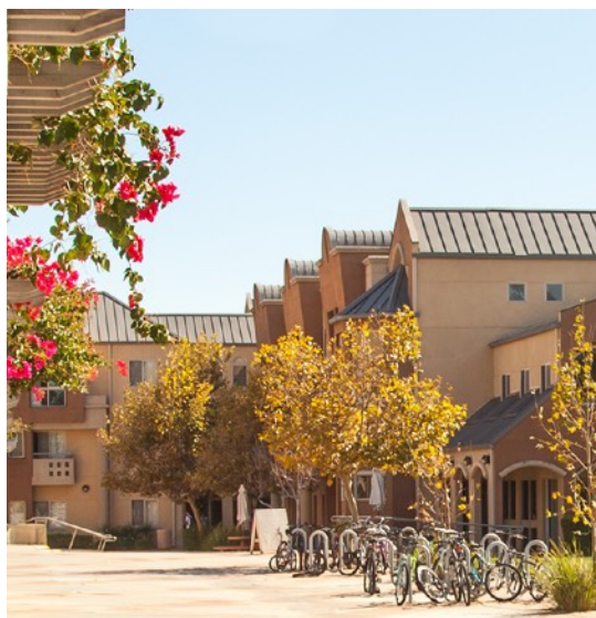
图为国际生校园宿舍 (International Village)