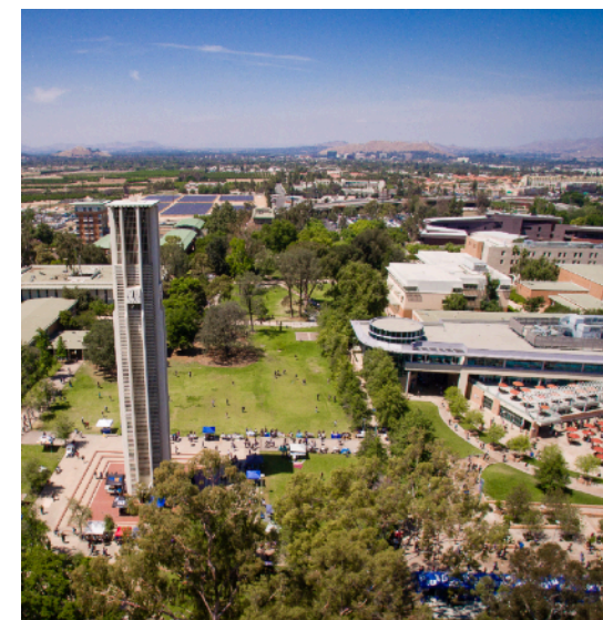
图为校园钟塔 (Bell Tower)