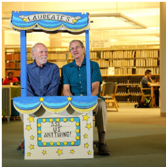
图为加州大学河滨分校诺贝尔获奖教授 Dr. Barry Barish 和 Dr. Richard Schrock，在学校图书馆和学生互动，举行Ask Me Anything活动