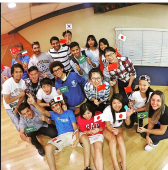
图为国际项目中来自世界各国的留学生