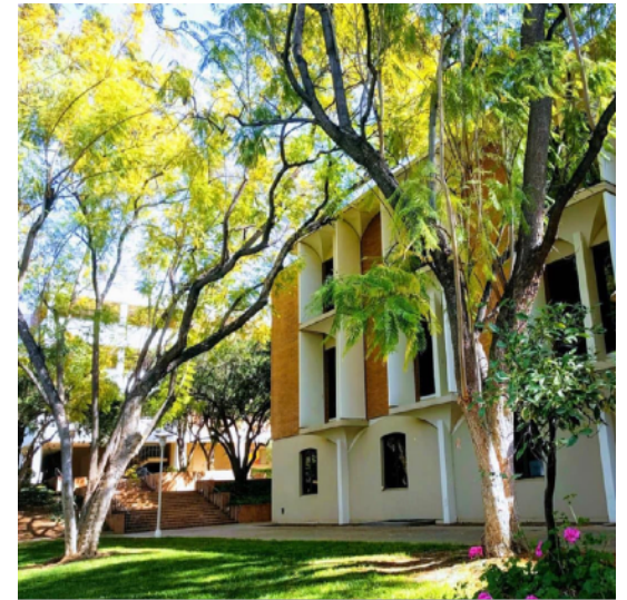
图为加州大学河滨分校校园一隅。学校还拥有在全加州都享有盛誉的大学植物园(UCR Botanic Garden)