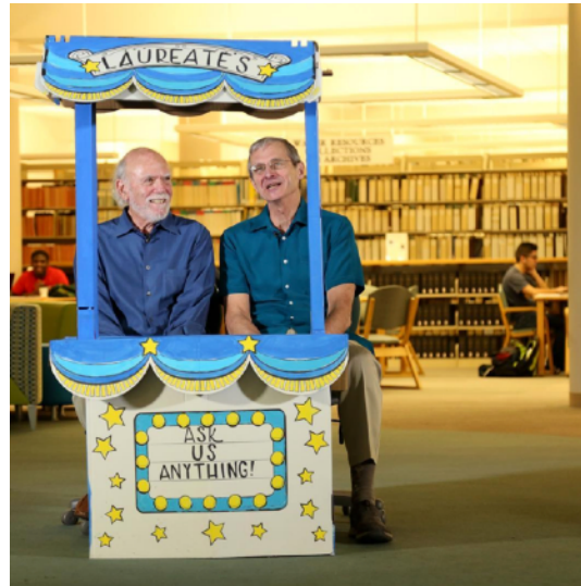
图为加州大学河滨分校诺贝尔获奖教授 Dr. Barry Barish 和 Dr. Richard Schrock，在学校图书馆和学生互动，举行Ask Me Anything活动